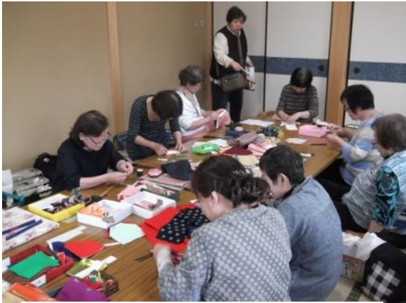
《おしゃべりをしながらも皆真剣です》

ナルクサロンで“着物姿のメガネ入れ”を作りたいという要望があり、急ぎよ5月と6月の2回にわたり同好会を開催しました。皆さんの家にあった古い着物の